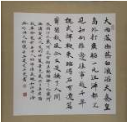
袁亚东《浪淘沙·北戴河》书法类第一名