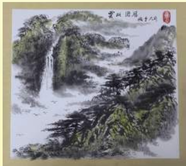
孔宪玉《云山固居》绘画类第三名